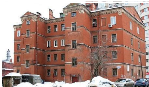
Здание бывшей Смоленской воскресной школы, где преподавала Н.К. Крупская.

Улица Шелгунова. Василий Андреевич Шелгунов (1867—1939), один из старейших участников социал-демократического движения, член Коммунистической партии с 1898. С 1894 года работал и вёл революционную пропаганду на Обуховском заводе, на его квартире (Ново-Александровская улица, 23, ныне в здании Народный музей рево-