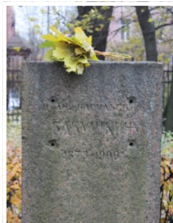
Так выглядел памятник Бабушкину в парке его имени ранее, таким он стал теперь.