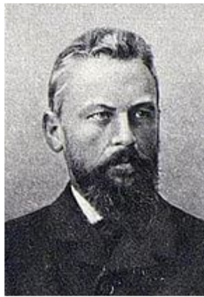
Михаил Степанович Ольминский