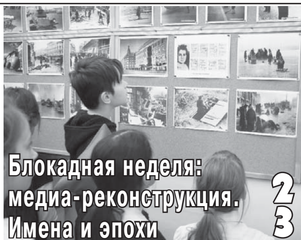
Блокадная неделя: медиа-реконструкция. Имена и эпохи 2 3