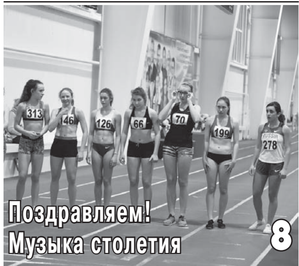
Поздравляем! Музыка столетия 8