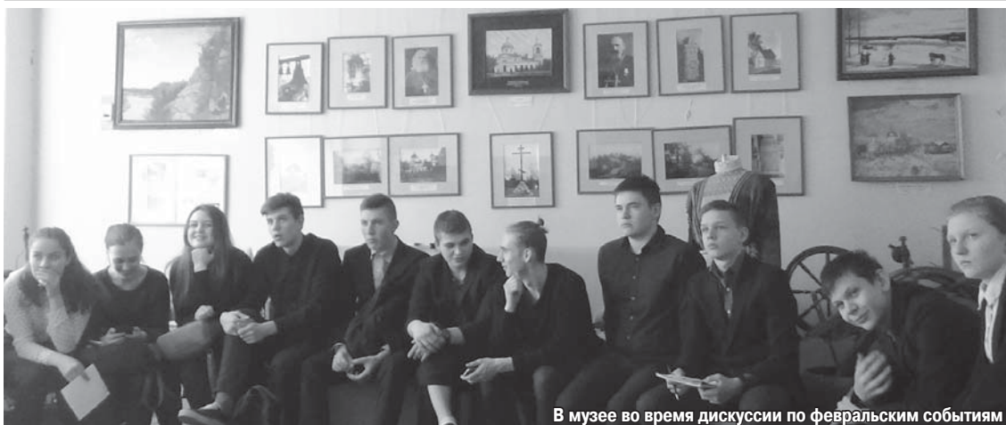
В музее во время дискуссии по февральским событиям

Германское правительство, благодаря эффективному шпионажу, было отлично информировано о положении дел в Петербурге, и оно открыло большевикам большой кредит на пацифистскую пропаганду, предполагающую государственный переворот.