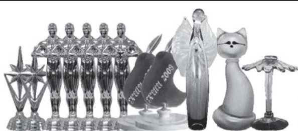
газета выходит с сентября 2004 года