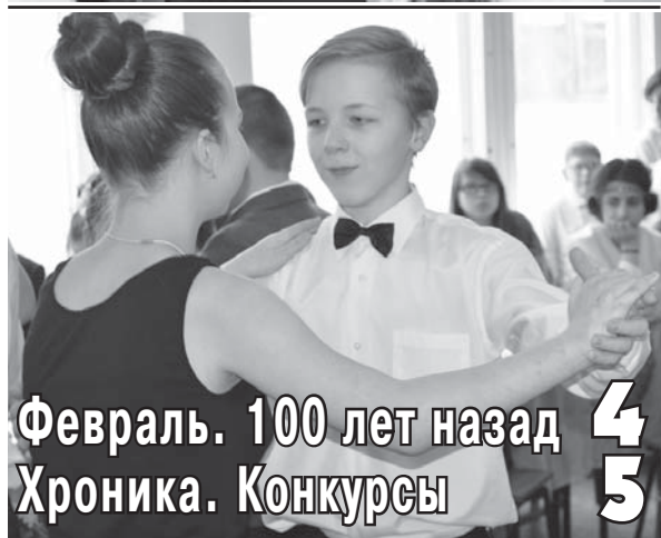
Февраль. 100 лет назад Хроника. Конкурсы 4 5