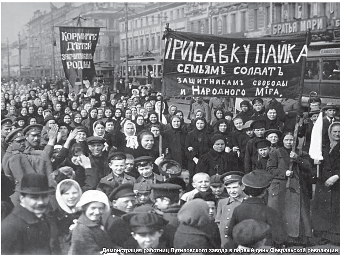
Демонстрация работниц Путиловского завода в первый день Февральской революции