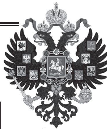
Герб Российской империи