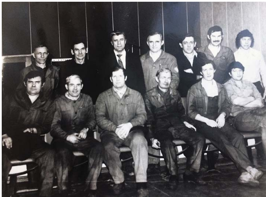
С друзьями-станочниками, 1975 год

— Я жил и учился в деревне, в то время школа состояла из семи классов, которые я успешно окончил. После чего намеревался выучиться на грузчика, но одна случайная встреча в корне изменила всю мою жизнь. В училище, куда я собирался поступать, ко мне подошел незнакомый парень и за короткое время убедил, что мне, такому молодому и амбициозному (как он это понял за 15 минут знакомства?), не гоже всю оставшуюся жизнь посвящать этой неблагодарной