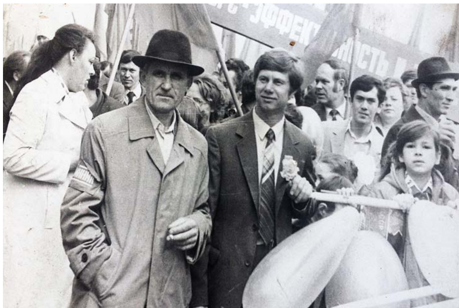
Праздничная колонна рабочих «Ростсельмаша» 1 мая 1975 года

— Да, это были первые шаги. Официальным же днем рождения «Ростсельмаша» считается 21 июля 1929 года, когда заводом была произведена первая продукция. И все начинает меняться: