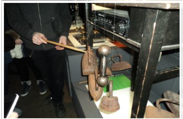
Кто сказал, что утюги и гантели не имеют отношения к музыке?