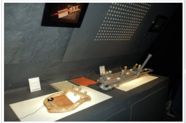
А вы ноктюрн сыграть смогли бы на флейте из водопроводных труб?