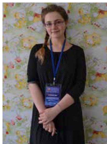
Главный редактор «Очной ставки»

Мы постарались осветить как можно больше событий и сделать этот журнал столь же насыщенным, какими были наши дни здесь. Судить, конечно же, нашим дорогим читателям — то есть вам. Желаем приятного чтения и ждем вашей справедливой оценки!