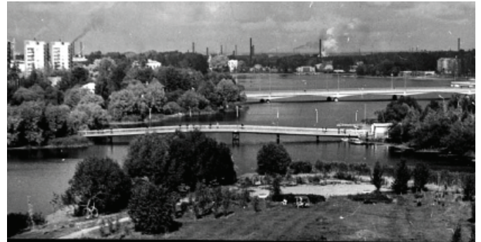
Разлив реки Ижоры, мост в Парк Культуры и отдыха и Большой Ижорский мост

В конце XX века Ижора была одним из основных и любимых центров для отдыха наших бабушек и дедушек. Если вы спросите у них, как выглядела Ижора в то время, вы услышите, что Ижора была очень чистой рекой. Каждый день на берегах Ижоры можно было встретить рыбаков, которые ловят рыбу, даже зимой они не забывали о своем любимом занятии. Площади всегда были полны народу, каждый любил проводить летние дни на пляже.