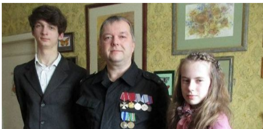
С трудом уговорили хозяина надеть форму и сфотографироваться