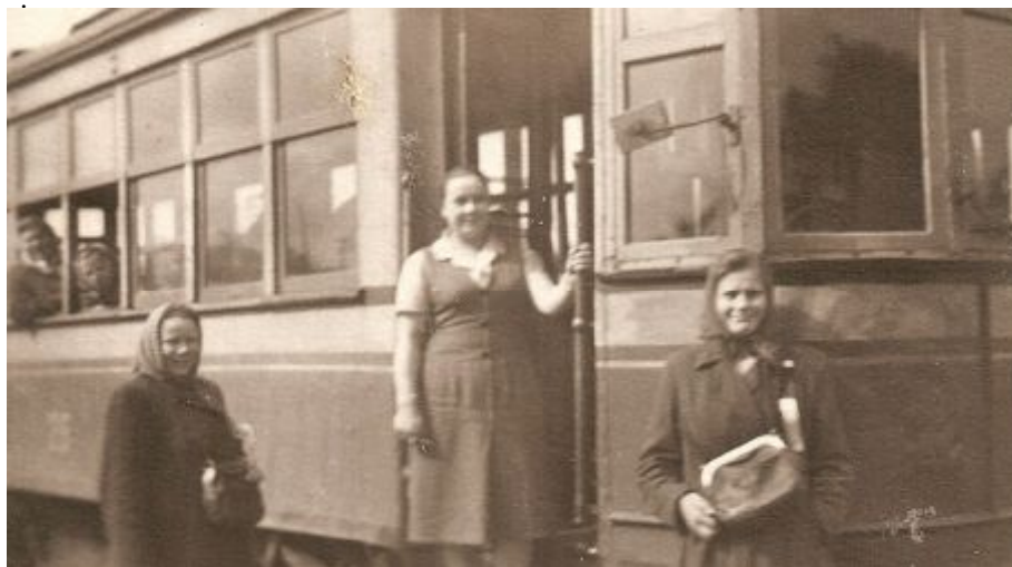
Вот такие были трамваи в 50-е годы с незакрывающимися дверями