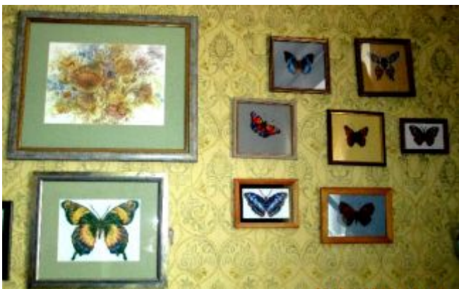
Стены украшали многочисленные вышивки с бабочками