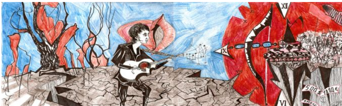
Рисунок Софьи Михайловны, выпускницы 2009