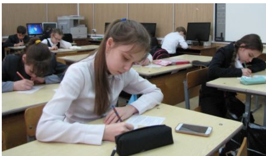
Фото Дениса Шоронова, 11А